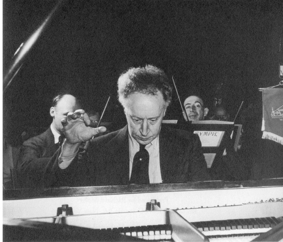
Arthur Schnitzler, 1946