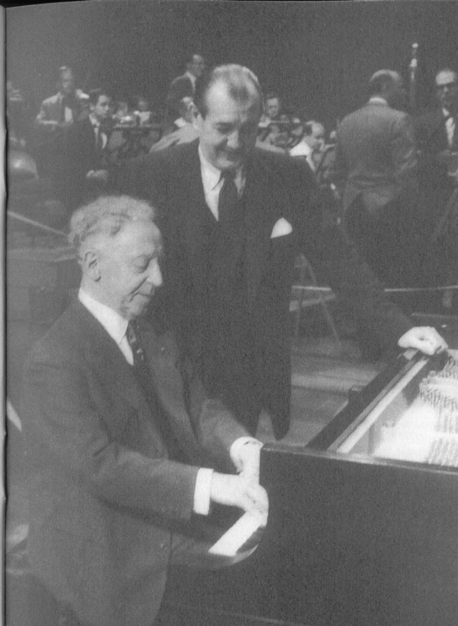
Rubinstein, Alfred Wallenstein

Ein leidenschaftliches und zugleich monumentales Antrittsthema leitet auf grandiose Weise den ersten Satz ein, der mit scherzo-artigem Material im Übergangsteil zu einem lyrischen zweiten Thema führt. Die süße und manchmal verträumte Wehmut des zweiten Satzes wird von einem strahlenden, aber teuflisch schwierigen Zwischenspiel unterbrochen, doch endet der Satz ebenso still wie er begonnen hat. Das schwindelerregende Finale—Allegro con fuoco—ist zwar mit einem etwas ruhigeren untergeordnetem Thema durchsetzt, hat aber eine Triebkraft von explosiver Energie und stürmt einem erregenden, begeisternden Höhepunkt entgegen.