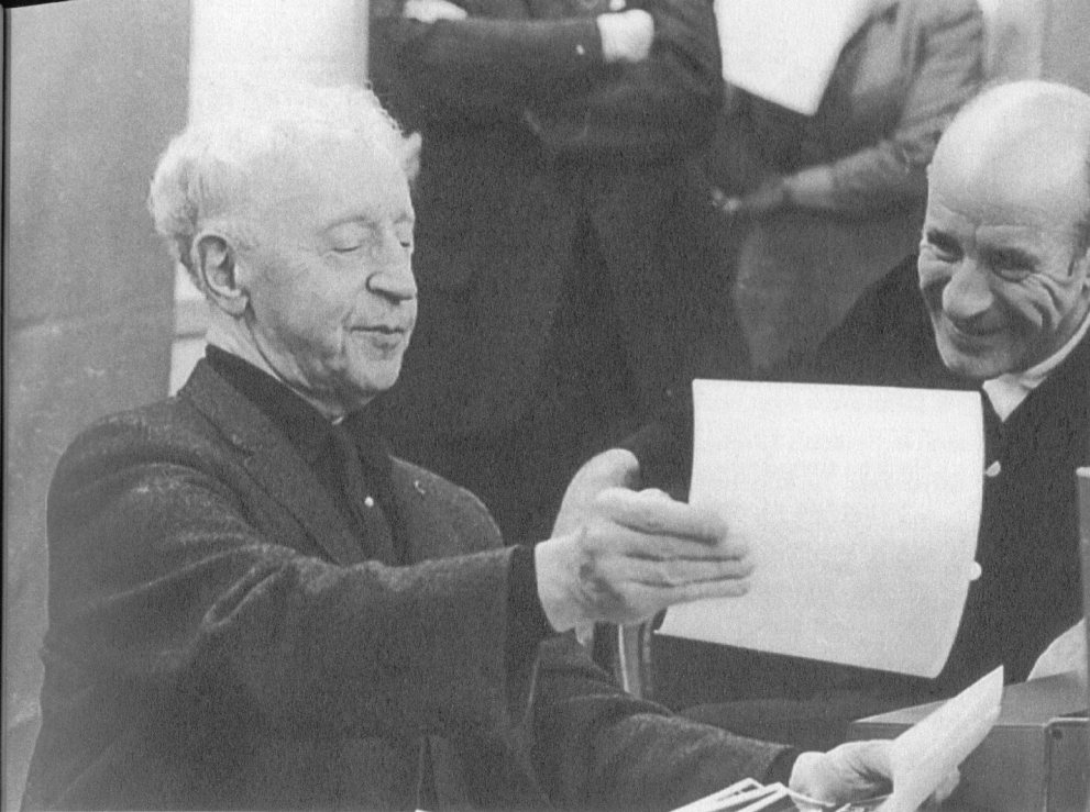
Rubinstein, Erich Leinsdorf BMG Classics

Un premier thème à la fois passionné et monumental introduit avec audace le premier mouvement, qui possède quelques éléments en manière de scherzo dans sa section de transition et un second sujet lyrique. La mélancolie douce et par moments onirique du deuxième mouvement est interrompue par un interlude brillant et terriblement difficile, mais le mouvement se termine aussi paisiblement qu'il a débuté. Bien que le finale enivrant soit ponctué d'un thème subordonné un peu plus calme, il avance en grande partie avec une énergie explosive et fonce vers un apogée affolant et tonitruant.