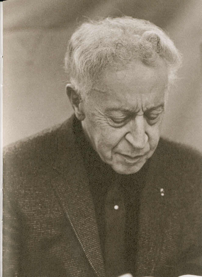
Arthur Rubinstein, 1963

brings together all of his approved, commercially released recordings made between 1928 and 1976. They progress in approximate chronological order, with the earliest recordings appearing in volumes 1-9, and the last in volume 81. All of the albums in The Arthur Rubinstein Collection were compiled from original sources. Disc-to-digital transfers were made, whenever possible, directly from metal stampers. Tape sources were transferred through CELLO playback electronics and remastered in 20-bit technology using universally compatible UV22™ Super CD Encoding.