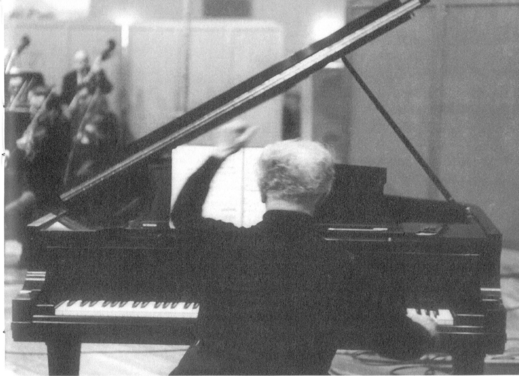
At Manhattan Center, 1961