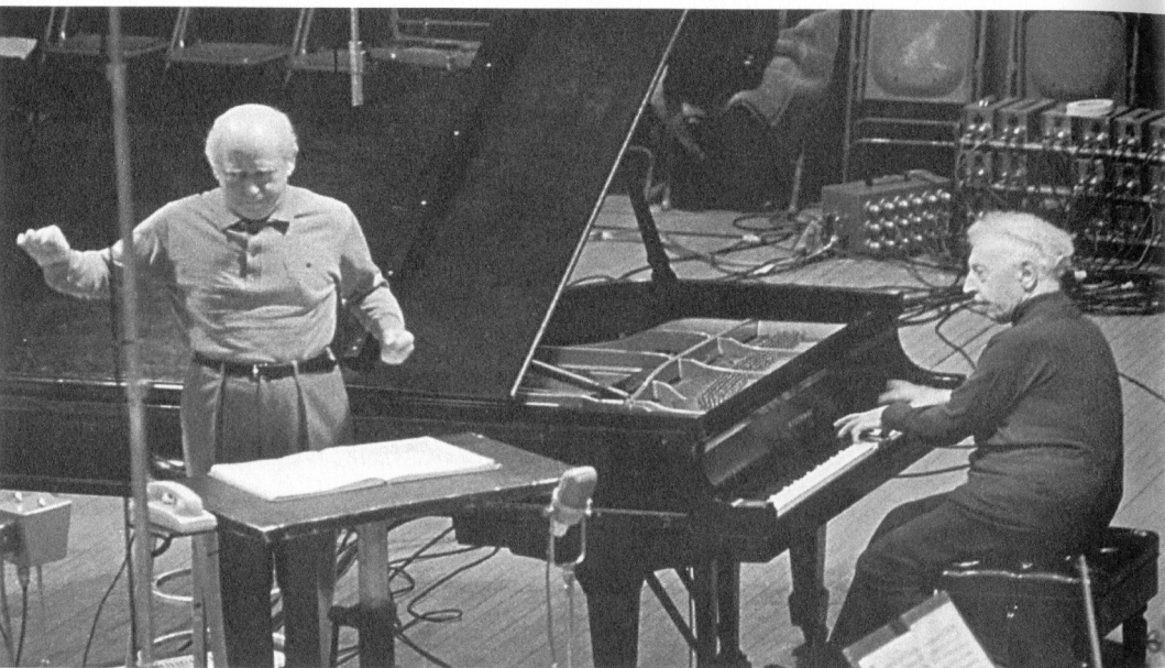
Eugene Ormandy, Arthur Rubinstein

Je tiefer das Herz angerührt wird, desto zurückhaltender, desto enigmatischer bringt es sich zum Ausdruck. [Edvard Grieg]